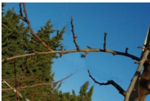
Repercement limité sur rameau mixte ayant produit

Les rameaux situés à l'ombre sont généralement fins. De plus, le repercement sur les rameaux ayant produit est moyen, il est essentiellement constitué de petites brindilles et de bouquets de mai.